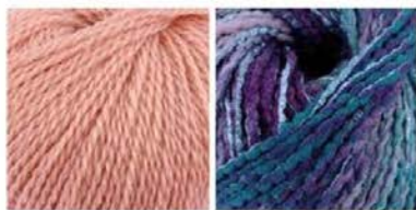
soavia 61 arti 83