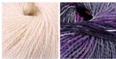
soavia 60 arti 88