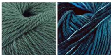
soavia 62 arti 84