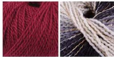
soavia 65 arti 80