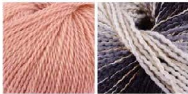
soavia 61 arti 80