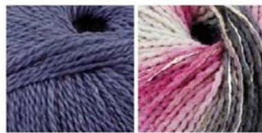
soavia 64 arti 82