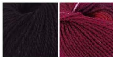
soavia 66 arti 89