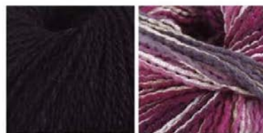
soavia 66 arti 85