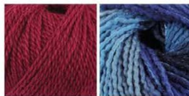
soavia 65 arti 87