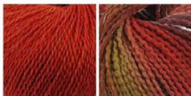
soavia 63 arti 81