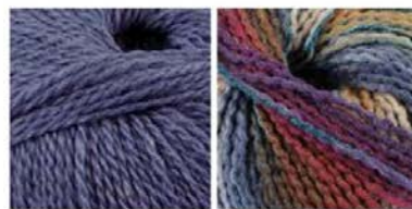
soavia 64 arti 86