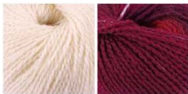
soavia 60 arti 89